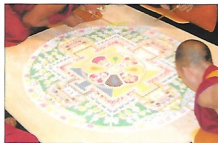
tvorba buddhistické mandaly*

Pojďme se společně vydat na cestu po tomto světadílu a nechme se okouzlit jeho exotickou tváří. Každá nová informace je jako zrnko písku. Samo o sobě malé nic, ale dohromady dokážou vytvořit krásný celek, jako je např. buddhistická (tibetská) mandala na obrázku, která je celá z písku.