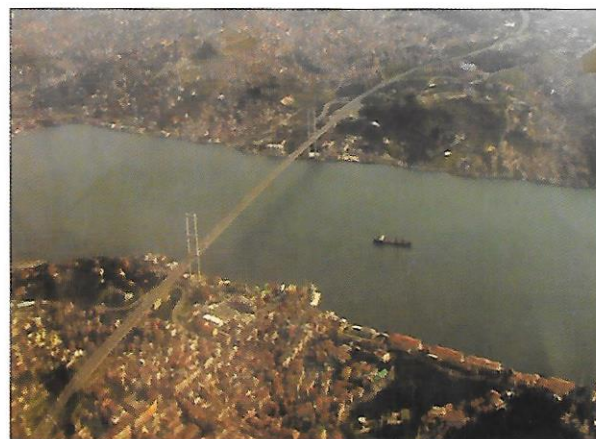
úžina Bospor v Turecku – vodní předěl mezi Asií a Evropou (jeden břeh je evropský, druhý asijský)

Spolu s Evropou tvoří Asie největší kontinent zvaný Eurasie . Pomyslným předělem mezi oběma světadíly je tzv. eurasijská hranice .