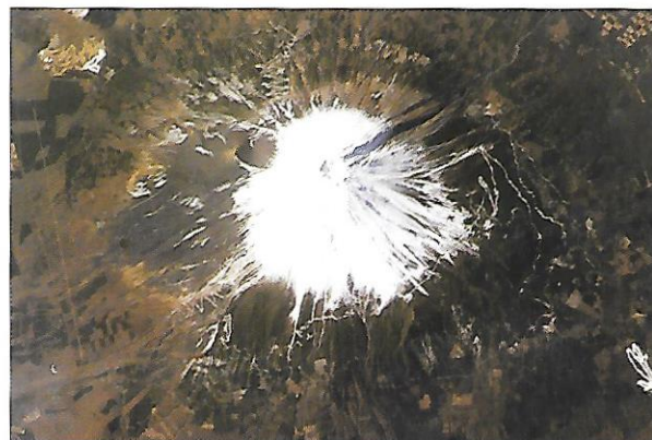
japonská sopka Fudžisan (Fudži) (3 776 m n. m.)

Vody tohoto moře jsou velmi slané (asi 11x slanější než jiná moře). Tělo se proto při koupání nemůže ponořit.