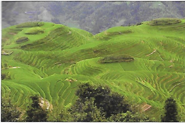
zemědělství – terasovitá rýžová polička (Čína)