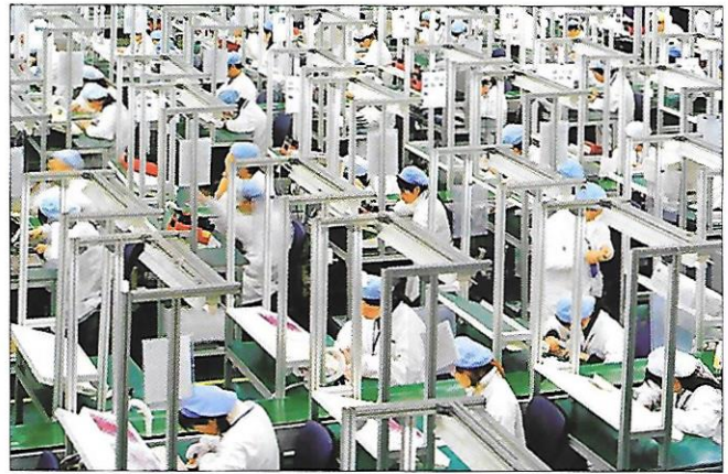
průmysl – textilní výroba (Čína)

Asijské hospodářství je velmi rozmanité . Existují zde vedle sebe moderní, vysoce výkonná průmyslová odvětví i velmi primitivní pracovní postupy. Hospodářsky významné jsou oblasti s vysokou hustotou obyvatelstva a soustředěným průmyslem. Většina obyvatelstva stále pracuje v zemědělství .