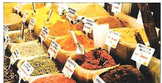
asijské koření (trh v Indii)