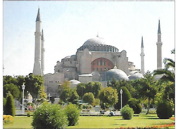
mešita Hagia Sofia (Istanbul)

Turecko je zemí s velmi bohatou historií . Turistický ruch přináší hospodářství významné zisky – turisty láká nejen krásné pobřeží, ale i řada památek.