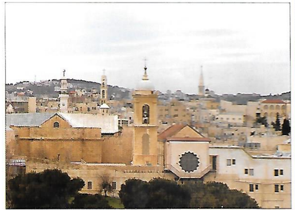
Betlém (město na západním břehu Jordánu) Je to významné křesťanské poutní místo s chrámem Narození Krista.

Vzhledem k válečnému napětí v oblasti Blízkého východu vybudoval Izrael velmi moderní a dokonale vyzbrojenou armádu .