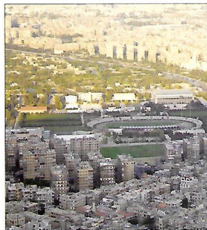
Damašek – hlavní město Sýrie Často je označován jako nejstarší trvale osídlené město na světě (osídleno asi 10 000 let př. n. l.).