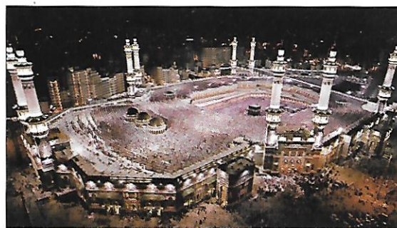
mešita v Mekce

Islám vznikl právě na území Saúdské Arábie. V jihozápadní části země leží město Mekka , kde se narodil prorok Muhammad – zakladatel islámu. Je nejsvětějším místem tohoto náboženství. Úkolem každého muslima je vykonat alespoň jednou za život pouť do Mekky. Směrem k Mekce se také obracují muslimové celého světa při každodenních modlitbách.