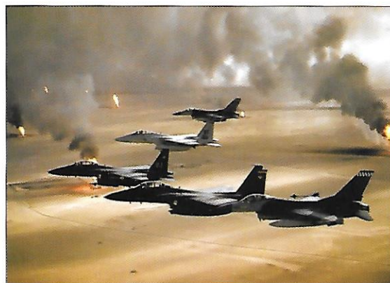
Kuvajt – letecký pohled na ropné vrty zapálené iráckou armádou

Ukažte jmenované státy na mapě. Jaké jsou zde zdroje pitné vody pro obyvatelstvo?