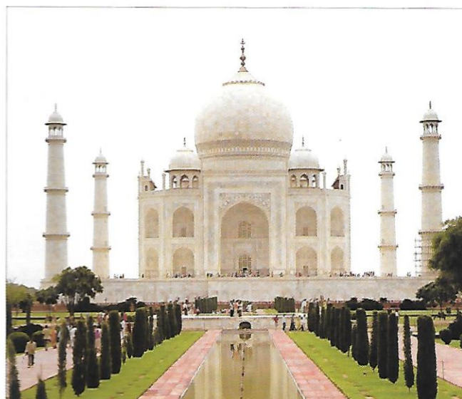
státy jižní Asie