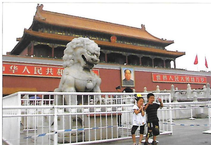
státy východní Asie