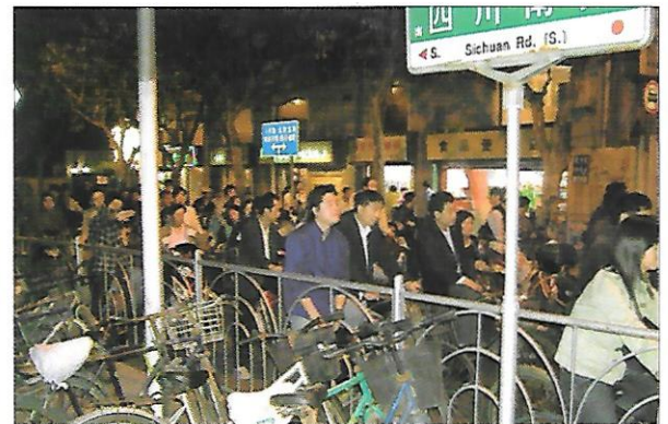
Číňané na cestě do práce Kolo je nejčastějším dopravním prostředkem. Pro většinu Číňanů je auto příliš drahé.