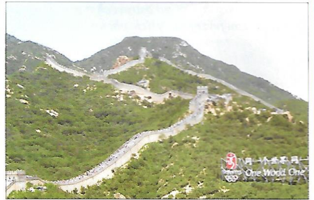
Velká čínská zeď – opevnění táhnoucí se napříč severní Čínou bylo budováno od 3. stol. př. n. l., aby chránilo Čínu před nájezdy kočovníků. Má délku přes 6 000 km.

Od roku 1997 je součástí Číny Hongkong jako její zvláštní autonomní správní oblast . Tato bývalá britská kolonie bývá označována jako hospodářský zázrak Asie. Je jedním z tzv. „ asijských tygrů “.