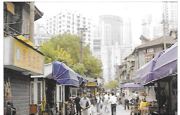
Shanghai [Šanghaj] – v popředí nuzné baráčky a krámký „Starého města“, vzadu nové mrakodrapy