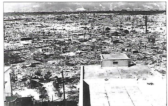
Hirošima po svržení atomové pumy v srpnu 1945

V Japonsku je okolo 150 sopek, polovina aktivních. V popředí kvetou sakury – druh japonských třešní.