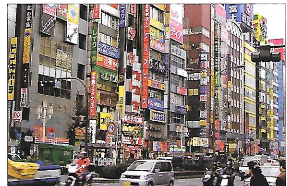
Tokio – hlavní město Japonska

Dosahuje průměrnou rychlost až 230 km/h. Síť těchto vlaků spojuje střediska čtyř největších ostrovů.