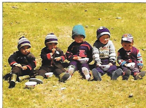
oběd na pastvinách centrální Asie (Kyrgyzstán)

Po 1. světové válce přišla do Kazachstánu početná skupina Čechů a Slováků. Jejich potomci zde žijí dodnes.