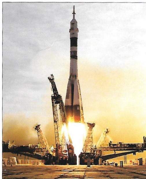
Bajkonur – na území Kazachstánu byl vybudován kosmodrom Bajkonur. Rusko si území kolem kosmodromu o rozloze 6 tisíc km 2 pronajalo od Kazachstánu na 20 let.