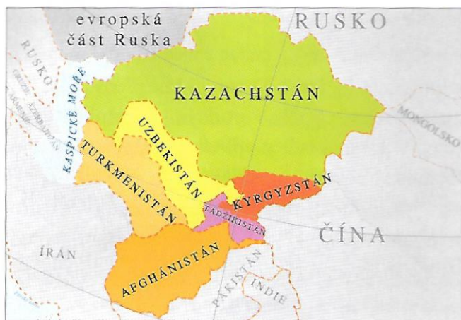
státy centrální Asie