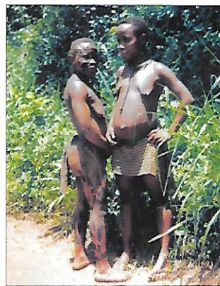
Pygmejové Říkají si „bamiki ba'ndure“, což znamená „dětí lesa“.

Pygmejové a Sanové jsou potomky nejstarších (původních) obyvatel Afriky. Představují přírodní národy, které se musely přizpůsobit pro člověka nepříznivým přírodním podmínkám. Obživu získávají sběrem kořínků a lovem drobné zvěře. Prakticky se izolovali od okolního obyvatelstva. Nesou proto velmi staré vývojové rysy člověka. Jak Sanové , tak Pygmejové jsou malých postav (muži do 150 cm, ženy jen 135 cm) s nápadně dlouhým trupem a krátkými končetinami.