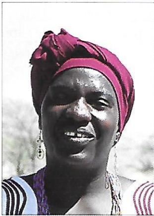
černoška z oblasti Guinejského zálivu